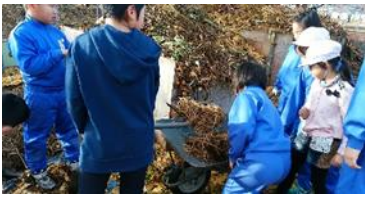
(※このサイクルをさらに充実したい)